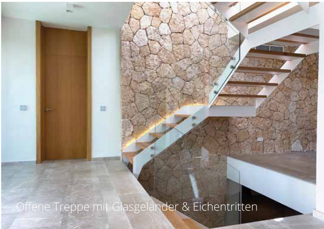
Offene Treppe mit Glasgelaender & Eichentritten