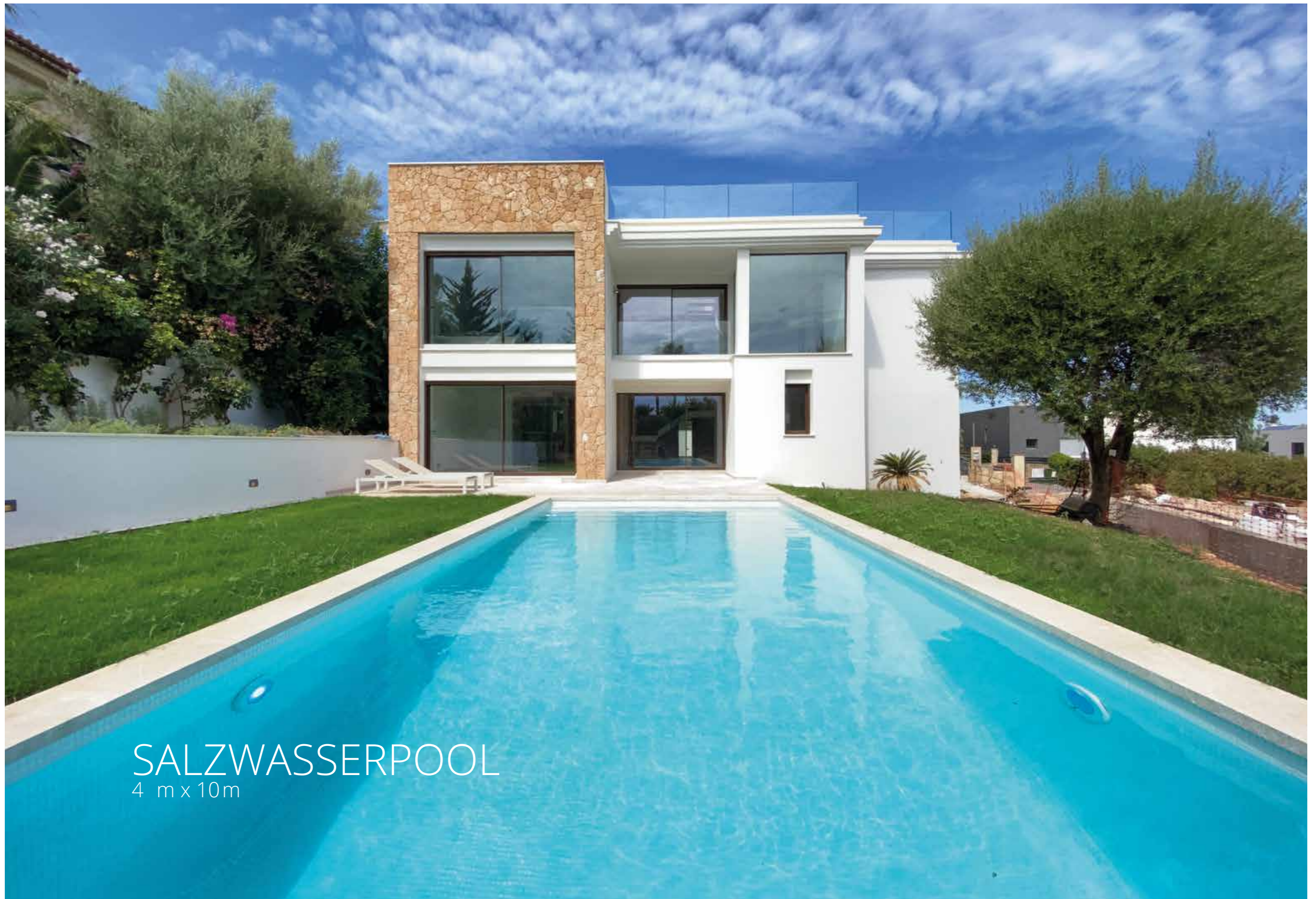
SALZWASSERPOOL 4 m x 10m