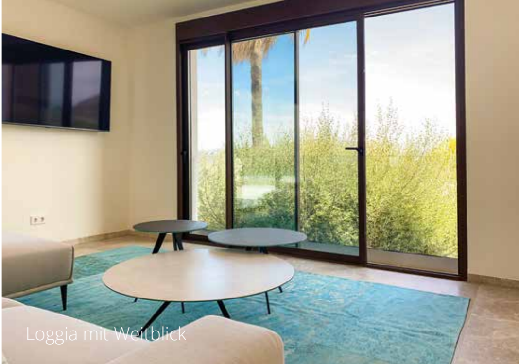
Loggia mit Weitblick