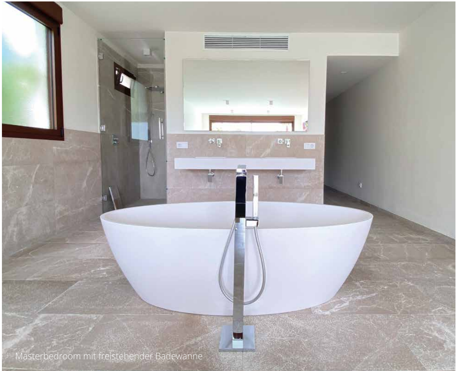
Masterbedroom mit freistehender Badewanne